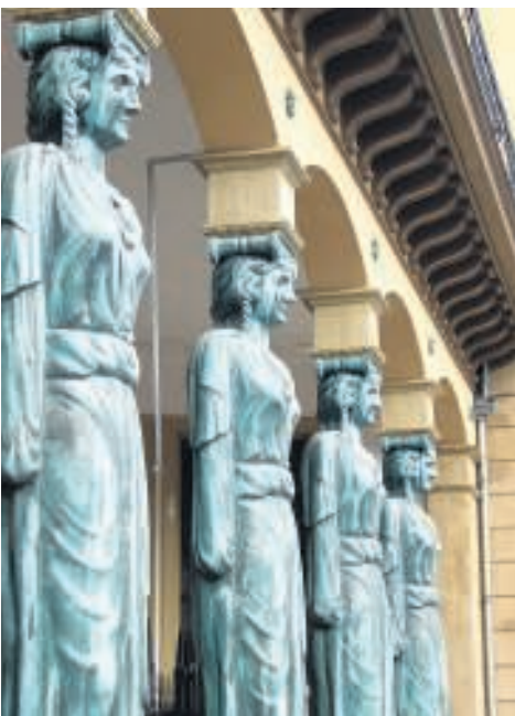
Boven: sculptuur aan lantaarnpaal, midden: gevelsteen van VOC-schip op een pand aan de Oude Gracht, Onder: de kariatiden van de Winkel van Sinkel, ook Oudegracht. Rechtsboven: de Universiteitsbibliotheek Letteren.

Er hangt een parfumwalm als we vanaf Vredenburg de Drieharingstraat inlopen. Twee luxe-drogisterijen lijken elkaar via de neuzen van potentiële klanten om het hardst te concurreren.